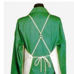
CÓDIGO: 2000.023 Delantal neopreno cruzado R-6 110 cm. 2000.024 Delantal neopreno cruzado R-6 120 cm.