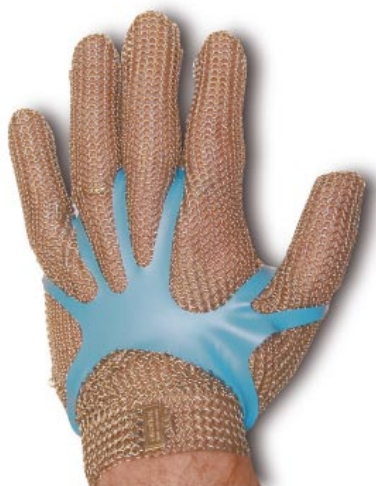
CÓDIGO: 1900.001 ○ Paquete 100 gomas blancas para guante de malla 1900.007 ● Paquete 100 gomas azules para guante de malla