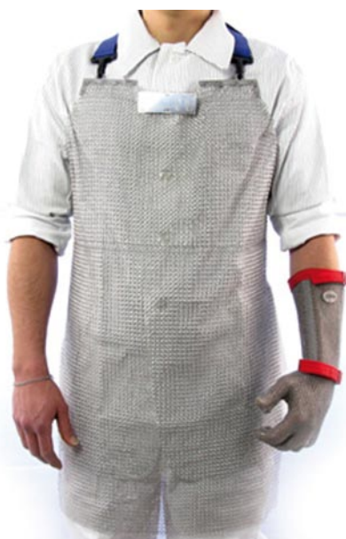
CÓDIGO: 1901.349 Delantal de malla 75x45 cm. 1901.350 Delantal de malla 80x55 cm. 1901.351 Delantal de malla 85x60 cm.