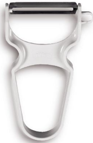
CÓDIGO PEDIDO: 2690.690 Pelador Y inox / plástico blanco