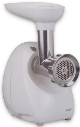
CÓDIGO PEDIDO: 5321.029 Picadora eléctrica N° 5 - 18,0x33,5x22,00